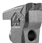
Dente Tipo C/3

Os dados referem-se à máquina como padrão. Os dados técnicos deste catálogo podem ser alterados sem prévio aviso.