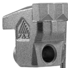
Dente Lateral C/3/SS